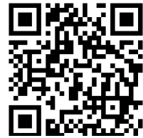
大会情報 web ページ

大会情報： https://jcsl.jp/category/event/taikai/