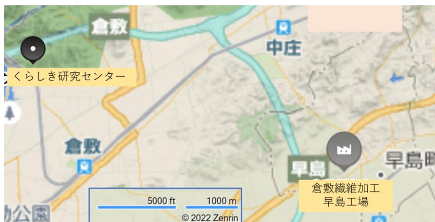
見学企業の地理的關係

以上に関するお問い合わせ：第4回年次大会 (倉敷大会) メールアドレス 2023kurashiki@isl.or.jp